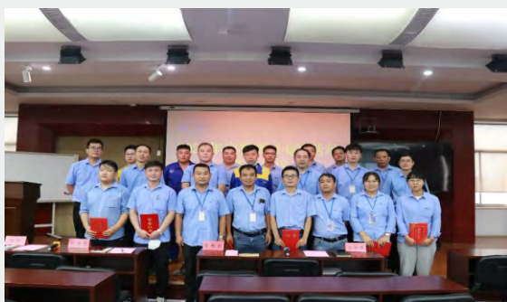
8月10日，安徽理士供应链质量管理部组织举行“2022年第一轮QCC活动颁奖仪式”。（通讯员 孟庆磊）