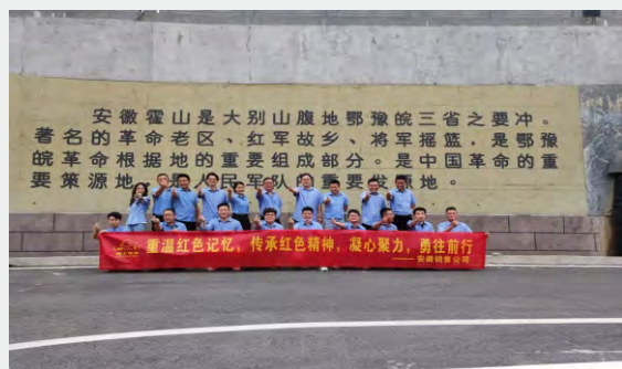
近日，理士国际安徽销售公司在霍山举行团建活动。（通讯员 王凯旋）