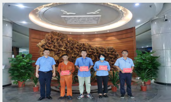
8月11日，肇庆理士举行7月份员工爱心基金颁发仪式。（通讯员 肖汝婷）